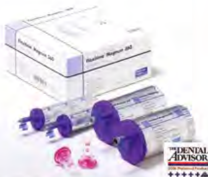
Flexitime Magnum 360 Heavy Tray (базовый материал с высокой конечной твердостью для автоматического смешивания)

Качественные оттиски — залог точного протезирования. Это является фундаментальной основой качественного ортопедического лечения. В достижении оптимального результата решающую роль играют два основных требования: