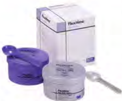
Flexitime Easy Putty (базовый материал ручного смешивания)