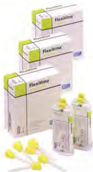
Flexitime Correct Flow (универсальный материал для коррекции)